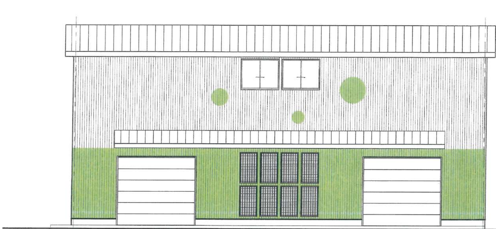
A 立面図 S:1/100