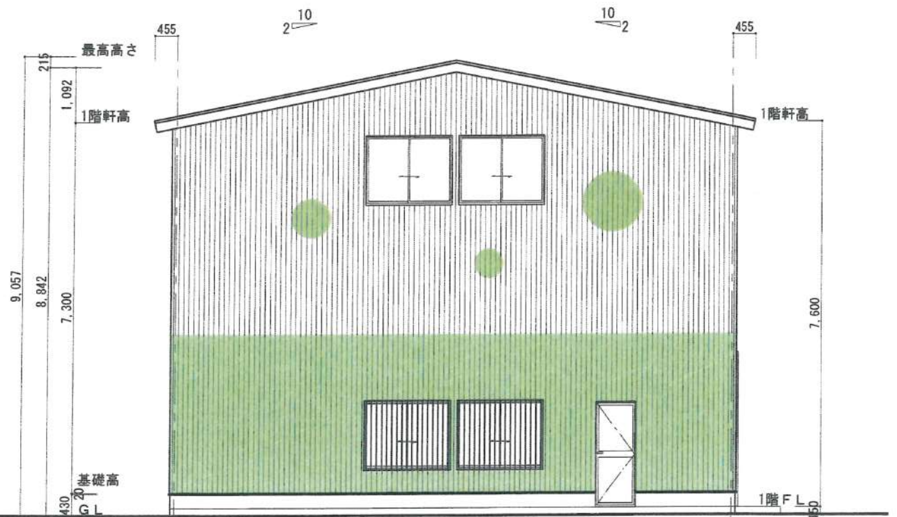
B 立面図 S:1/100