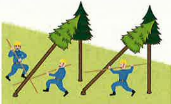
(図2)かかり木の処理

<注意> 「かかっている木の元玉切り」(かかった状態のまま元玉切りをし、地面等に落下させることにより、かかり木を外すこと。)(図5)は、今般の改正により禁止されるものではありませんが、かかり木の安全な処理方法とは言えないことに留意してください。