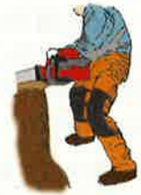
（図7）下肢の切創防止用保護衣

＜注意1＞（図7）で例示した下肢の切創防止用保護衣は、前面にソーチェーンによる損傷を防ぐ保護部材が入っており、JIS T8125-2に適合する防護ズボン又は同等以上の性能を有するものを使用してください。また、労働者の身体に合ったサイズのもを着用してください。既にソーチェーンが当たって繊維が引き出されたものなど、保護性能が低下しているものは使用しないようにしてください。