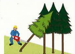
(図5)かかっている木の元玉切り