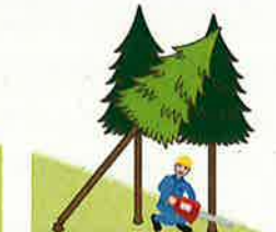
(図3)かかっている立木の伐倒