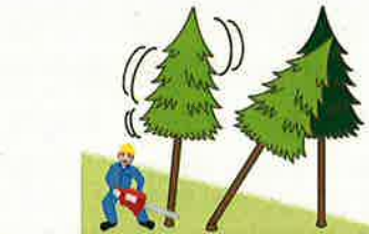
(図4)かかり木に激突させるためにかかり木以外の立木の伐倒