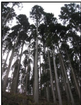
新潟県林業改良協会