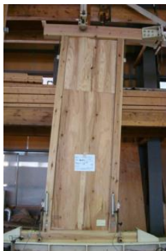
表1 耐力壁パネルの仕様と壁倍率等