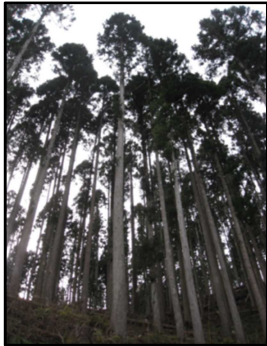
新潟県林業改良協会

みなさんに「Cryptomeria Niigata <新潟のスギ>」の発行について、お知らせをします。数年前から、当連合会や県森林研究所に県産スギの特性をとりまとめたハンドブックの発行を望む声が寄せられています。